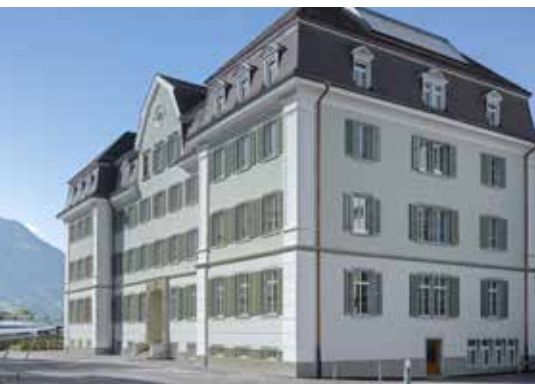
Internat du collège bénédictin à Sarnen