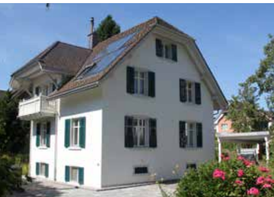
Maison familiale à Rüti

Nous avons choisi le Fixit 222 Aerogel Enduit thermo-isolant haute performance pour la rénovation de la façade de notre maison. Un système de panneaux isolants aurait complètement modifié l'aspect extérieur du bâtiment. Le haut pouvoir isolant, combiné avec les propriétés positives sur le climat ambiant, ainsi que les plus hautes températures sur les surfaces des parois durant la période de chauffage sont clairement perceptibles. Par contre en été, les pièces restent agréablement fraîches, l'humidité de l'air est stable et le climat ambiant plaisant. Grâce à la faible épaisseur de couche de seulement 4 cm, nous avons pu conserver le caractère original du bâtiment et divers travaux supplémentaires ont pu être épargnés. Monsieur A. Zumbühl, Rüti (maître de l'ouvrage)