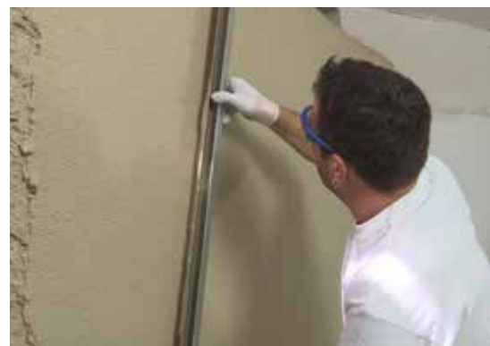
Tirage à la règle du Fixit 244 Aerogel Enduit thermo-isolant