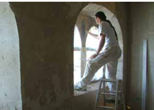
Ancien hospice, St. Gothard

Ce bâtiment de 195 ans est aujourd'hui placé sous la protection des monuments historiques. À l'époque, il abritait une boulangerie-pâtisserie connue loin à la ronde pour ses spécialités. Avec grand amour et respect du patrimoine historique, le bâtiment a été transformé en maison d'habitation. Respectant les directives de la protection des monuments historiques, la façade a été revêtue d'un enduit isolant protecteur, le Fixit 288 Calce Clima Thermo à base de chaux.