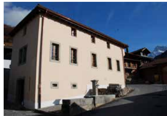
Maison Forte après l'assainissement, Chêne-sur-Bex