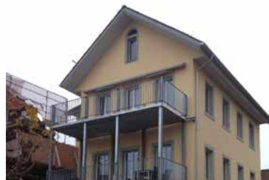
Maison d'habitation, Hägglingen