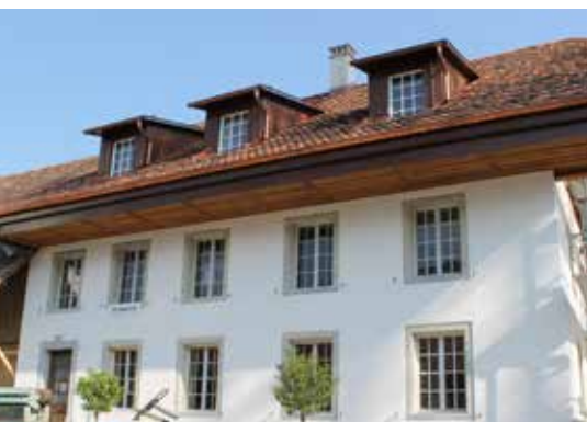
Maison d'habitation assainie à Hägglingen

Vous trouverez des informations détaillées sur le Fixit 288 Calce Clima Thermo sur l'info produit ou sur le site Internet www.fixit.ch .