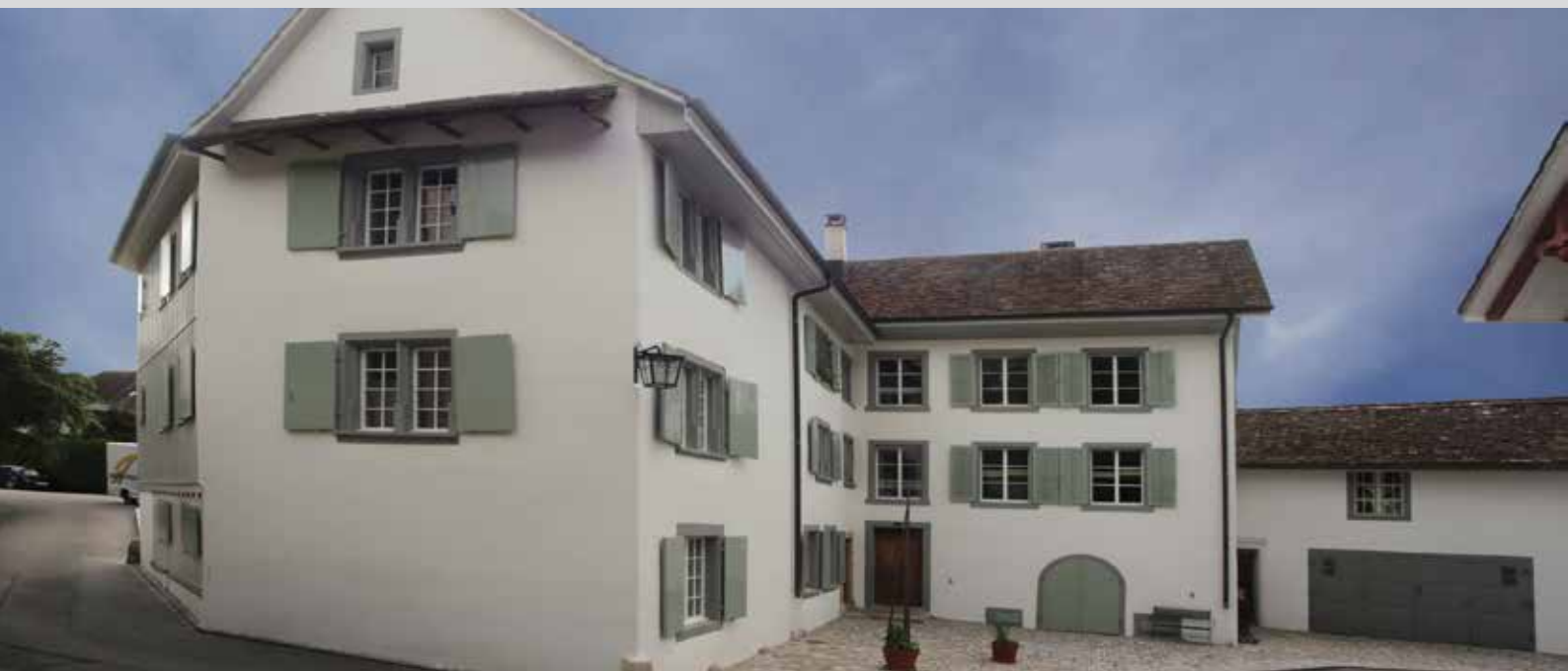
Ancien moulin à Sissach – assaini avec Fixit 222 Aerogel Enduit thermo-isolant haute performance

L'assainissement d'anciens bâtiments historiques de grande valeur pose toujours quelques questions quant au choix judicieux d'une isolation efficace et appropriée. L'apparence et le caractère de l'ancien bâtiment ne doivent en aucun cas être modifiés. En outre, l'espace restreint ne permet souvent pas d'utiliser les épais panneaux d'isolation conventionnels.