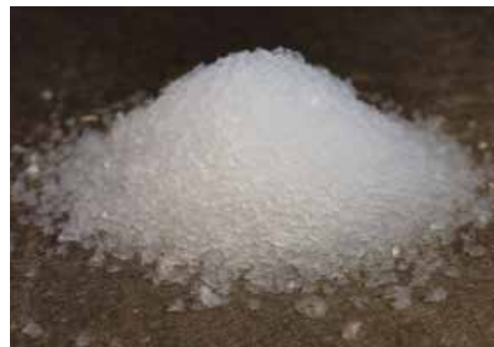
Agrégat de l'enduit thermo-isolant – granulats d'aérogel

Vous trouverez des informations détaillées sur le Fixit 244 Aerogel Enduit thermo-isolant sur l'info produit ou sur www.fixit.ch .