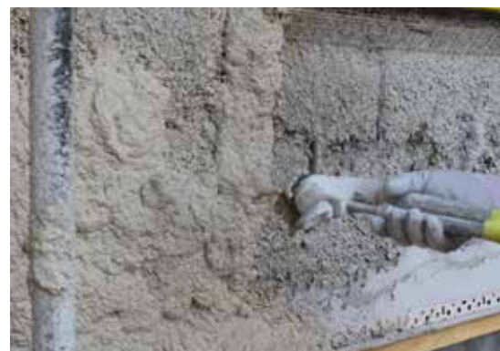
Application à la machine du Fixit 244 Aerogel Enduit thermo-isolant