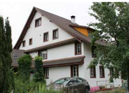
Bâtiment historique à Maschwanden