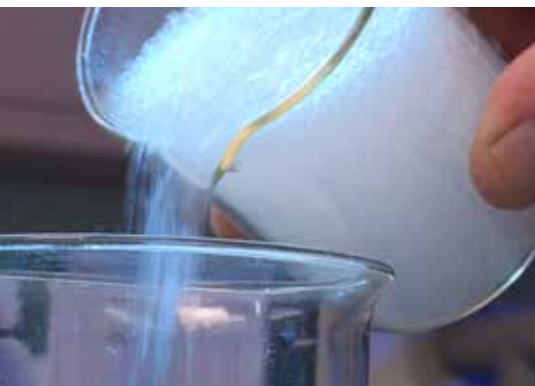
Structure hautement poreuse – Aerogel